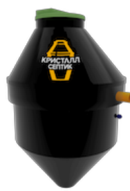
Септик Кристалл 8