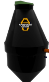
Септик Кристалл 8 Лонг