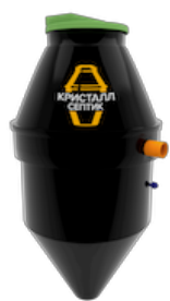
Септик Кристалл 5